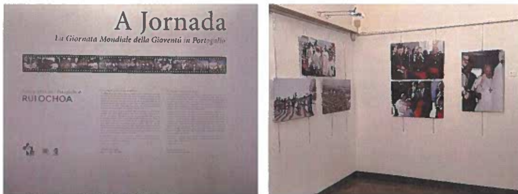
Figuras 7 e 8 – Exposição «A Jornada», Roma

No dia 13 de junho de 2024 , foi inaugurada a exposição de fotografias intitulada «A Jornada» 14 , da autoria de Rui Ochoa, no Instituto de Santo António dos Portugueses, em Roma. A exposição, que contou com o apoio da Fundação, reúne 44 fotografias que retratam a visita do Papa Francisco a Portugal por ocasião da Jornada Mundial da Juventude. A inauguração contou com a presença do então presidente da Fundação, cardeal D. Américo Aguiar.