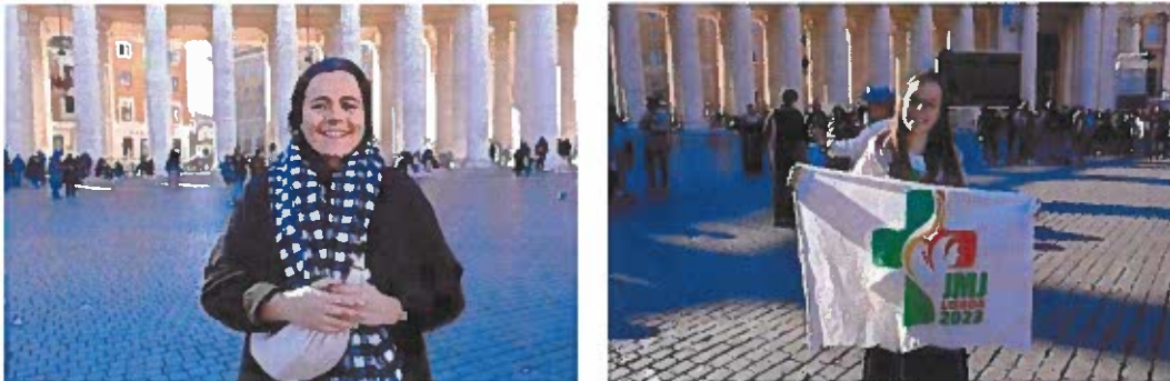
Figuras 17-20 – Passagem dos Símbolos da JMJ a Seul, Roma.