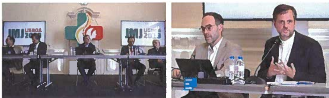
Figuras 1 e 2 – Apresentação Contas e Estudo de Impacto, Pavilhão Carlos Lopes