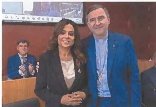
Figura 6 – Entrega de condecoração à autarca de Matosinhos