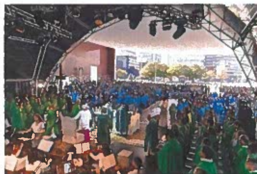
Figuras 13-16 – REJOICE! – Encontro Nacional da Juventude