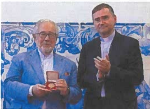
Figura 5 – Entrega de condecoração ao Presidente da Câmara Municipal de Oeiras