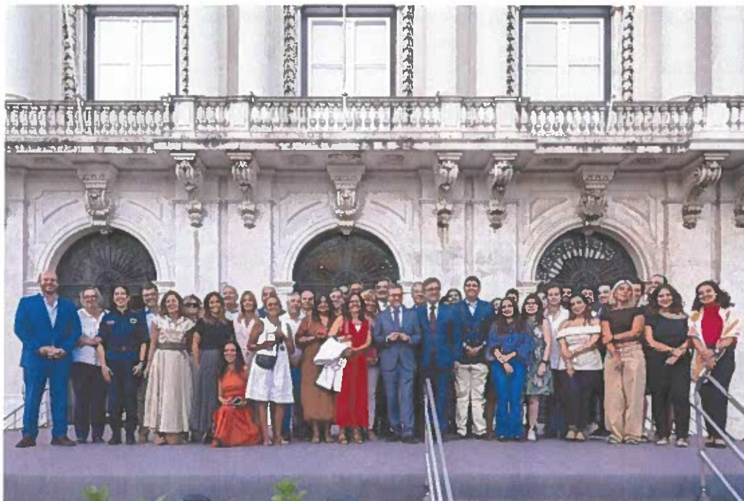
Figura 4 – Entrega de medalhas aos trabalhadores da Câmara Municipal de Lisboa